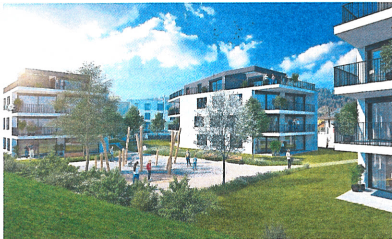
Visualisierung: Gebenstorf-Vogelsang, Lauffohrstrasse, Eigentumswohnungen.

0848 735 735 oder info@digare.ch . Zwysighof Wettingen, Donnerstag, 12. September, 18.30 Uhr.